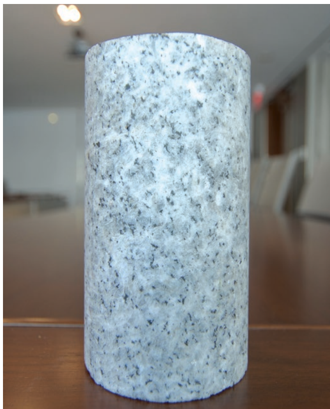
Exemple de carotte