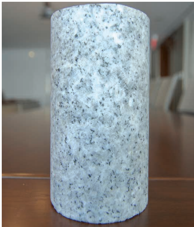
Exemple de carotte