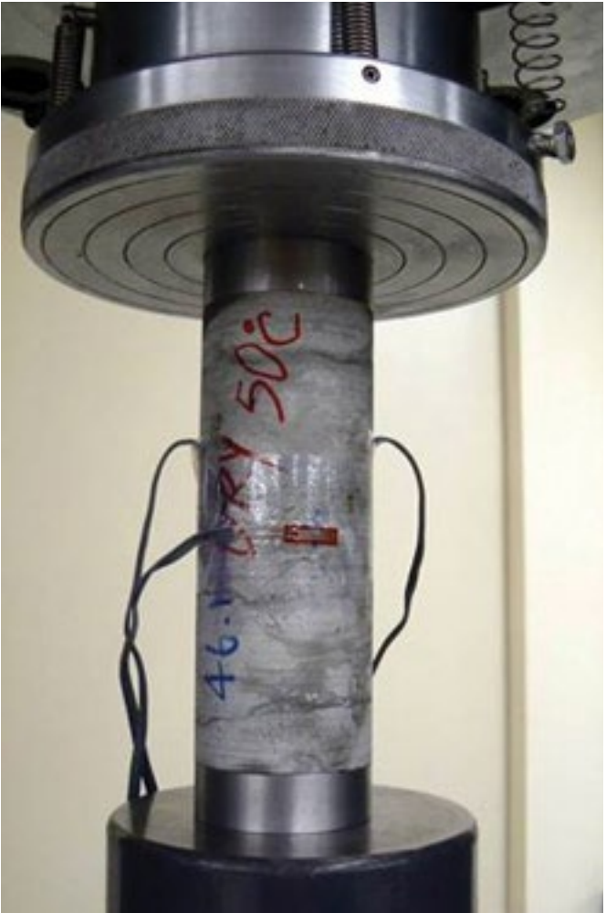
Exemple d'analyse géomécanique