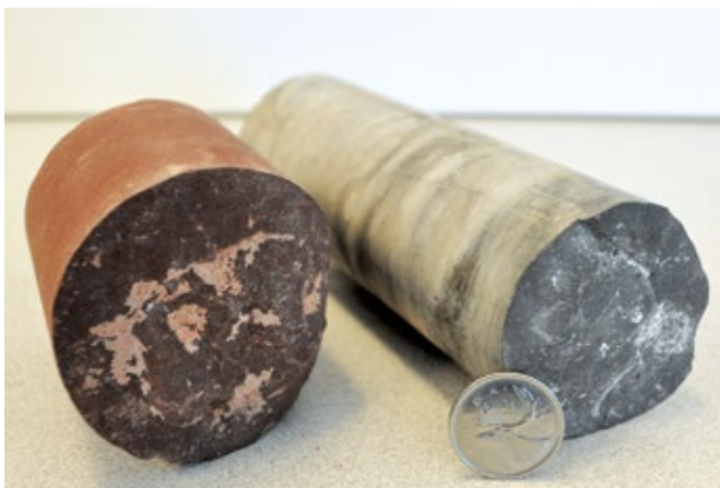
Exemples de carotte

Un trou de sonde est un trou étroit, profond et circulaire percé au moyen d'équipements de forage motorisés. Le processus consiste à percer un trou de sonde et à prélever des échantillons cylindriques, appelés carottes. Les carottes et les trous de sonde font l'objet d'un large éventail d'analyses qui servent à déterminer les propriétés de la roche examinée.