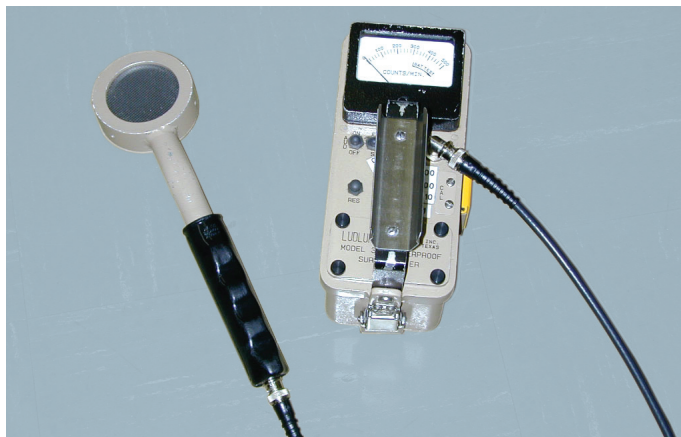
Figure 3 : Les radiamètres peuvent détecter même les plus faibles rayonnements

Les programmes de radioprotection font partie des exigences du permis d'exploitation d'installations nucléaires. Les permis ne sont accordés que si l'on peut faire la démonstration qu'un tel programme est en place. Pour plus d'information, veuillez visiter notre site Web au www.sgdh.ca .